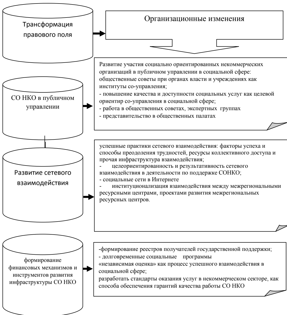
Рисунок 1 - Факторы, стимулирующие развития социально ориентированных НКО

По данным Общественной палаты, не во всех регионах нашей страны местные власти в должной мере поддерживают некоммерческий сектор. Проанализировав данные региональных реестров и региональных программ о поддержке НКО в период с января 2014 года по июль 2015 года, лидером списка по Центральному федеральному округу стала Воронежская область – 89,8 млн. рублей было выделено 104 НКО за 2014 год, цифра по 2015 году пока не ясна.